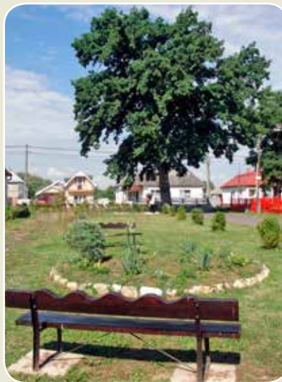
Park pod Dubom

ľudia možno ani nevedia, že Lastomír a Laborec sú tiež spojené nádoby, pretože voda z Laborca sa postupne vlieva do iných riek až napokon do mora. Znova sa odparuje a v podobe zrážok sa ako bumerang vracia zase späť a to je kolobeh, zákon prírody – zákon života. Hoci sa svet a život menia, žijeme tu len raz a preto by sme mali žiť podľa odkazu našich starých otcov: žiť čestne, pracovať a správať sa tak, aby sme sa raz za to nemuseli hanbiť. A práve teraz sa to najviac odzrkadľuje, keď mladý človek povie, že práca je najväčšia hlúposť na svete. Je to veľmi smutné počuť... Volakedy v celom svete bolo známe, že Slováci sú pracovitý národ, no dnes sa už Slováci odučili robiť... Je to naozaj na zamyslenie, čo môže byť lepšie a krajšie ako keď človek čestne pracuje a má z toho úprimnú radosť. A ešte keď sa to páci aj druhým ľuďom, potom je tá radosť o to väčšia. Tiež si každý musí uvedomiť že NIČ NA TOMTO SVETE NIE JE ZADARMO. Stále je to na vlastné alebo cudzie triko. Tak isto platí pravidlo: Nestáčí nasadnúť na lodku a nechať sa viesť, ale treba pomôcť veslovať, kormidlovať a správne nasmerovať, aby sme došli do cieľa. Toto som pochopil aj teraz, keď ma oslovil starosta našej obce pán Ľubomír Šipoš. Ani na chvíľu som nezaváhal a podal som pomocnú ruku. Tak spoločnými silami vzniklo celkom pekné dielo „Park pod Dubom“, ktorý bude slúžiť všetkým obyvateľom obce. Náš DUB nebude v parku sám, pretože